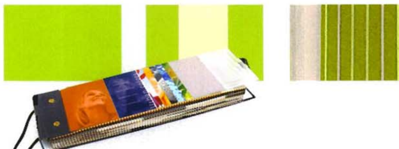
Image Fabrics: Tücher individuell, nach eigenem Wunsch gestaltet, das Design oder die Bedruckung können Sie selbst bestimmen.

Phantasiedesign: Tücher mit verschiedenen Streifen